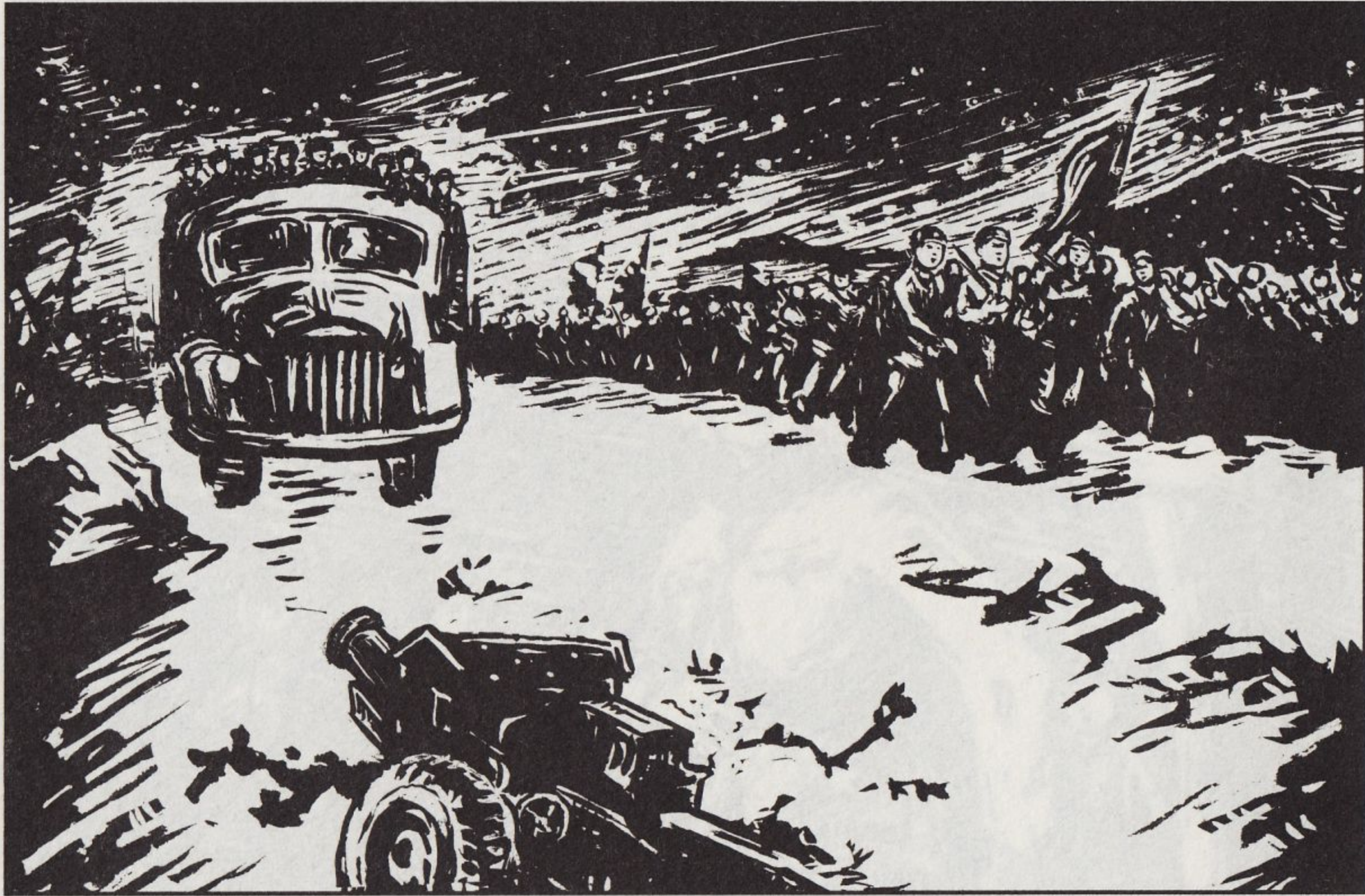
54 进军途中,步兵、炮兵、汽车、马车,川流不息,浩浩荡荡的大军,迎着凛冽的寒风,前进在冬夜的月光下。