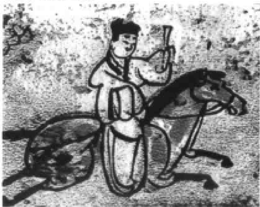
● 陕西西安西安东汉墓画像砖驿使图

区区尺牍，不仅开书法之源，亦是历代藏家之珍宝。孙过庭《书谱》中即有“旁窥尺牍，俯习寸阴”之句，并说谢安“素善尺牍”。可见，尺牍在魏晋