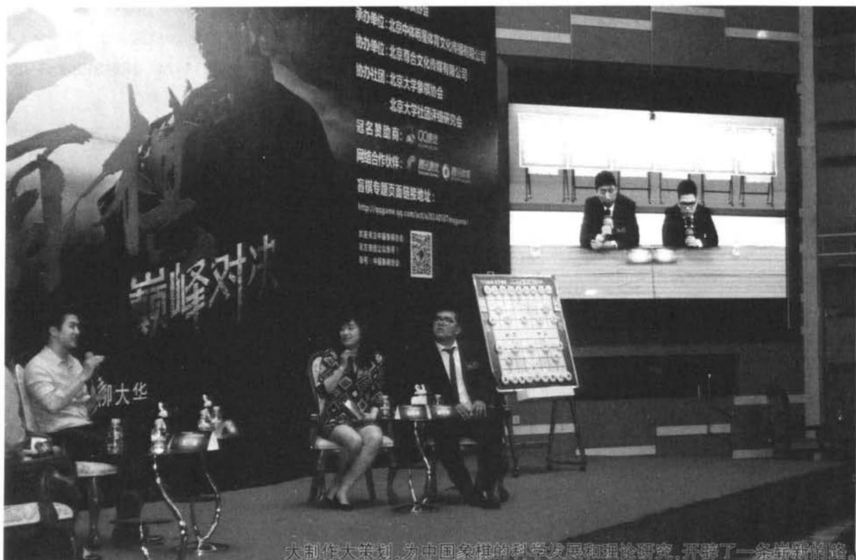
大制作大策划,为中国象棋的科学发展和理论研究,开辟了一条崭新的路。

我的房卡被朋友拿去了,在“锦江之星”没有房卡乘不了电梯(不刷卡,电梯不工作),大华说,跟我走,我送你到六楼。谁知他乘的贵宾电梯六楼不停,我们只好先到七楼,他硬坚持把我从安全通道送到