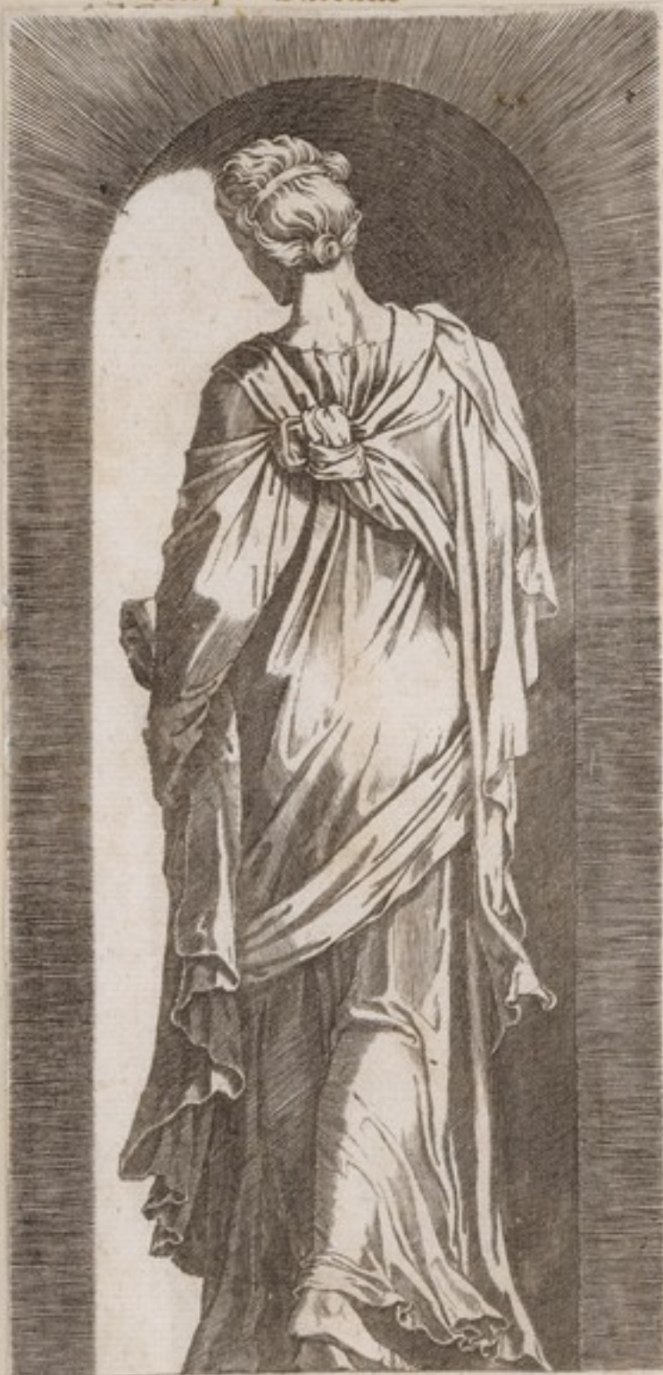
Yel Passado ya noes mio.