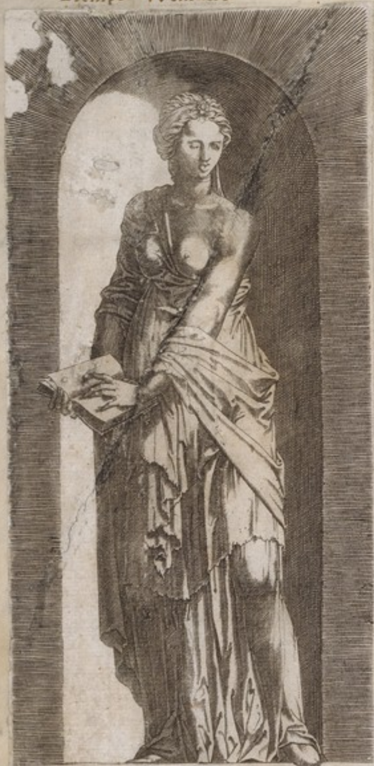
Nada tempo enel q̄ Wiene. L S