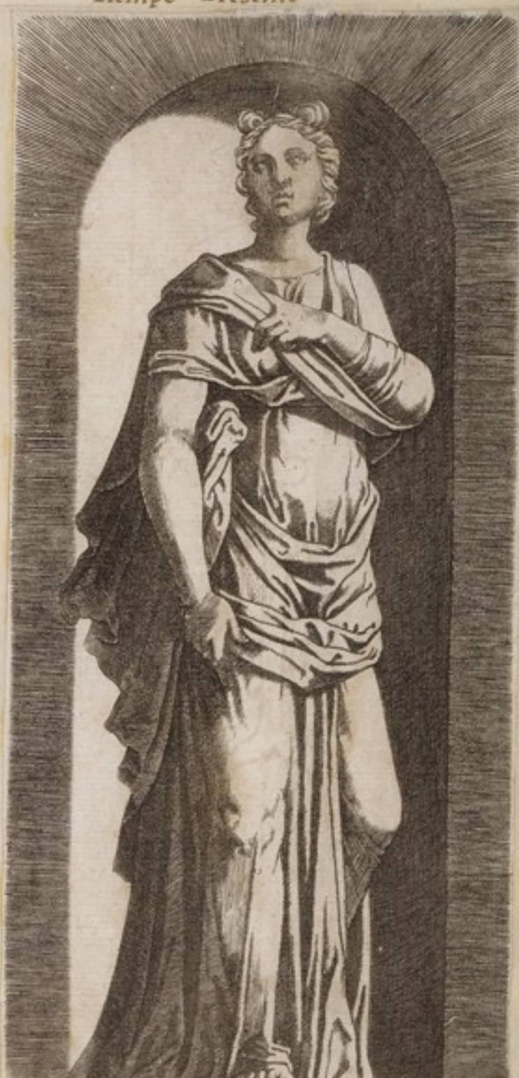
y enel Presente estoi Frio.