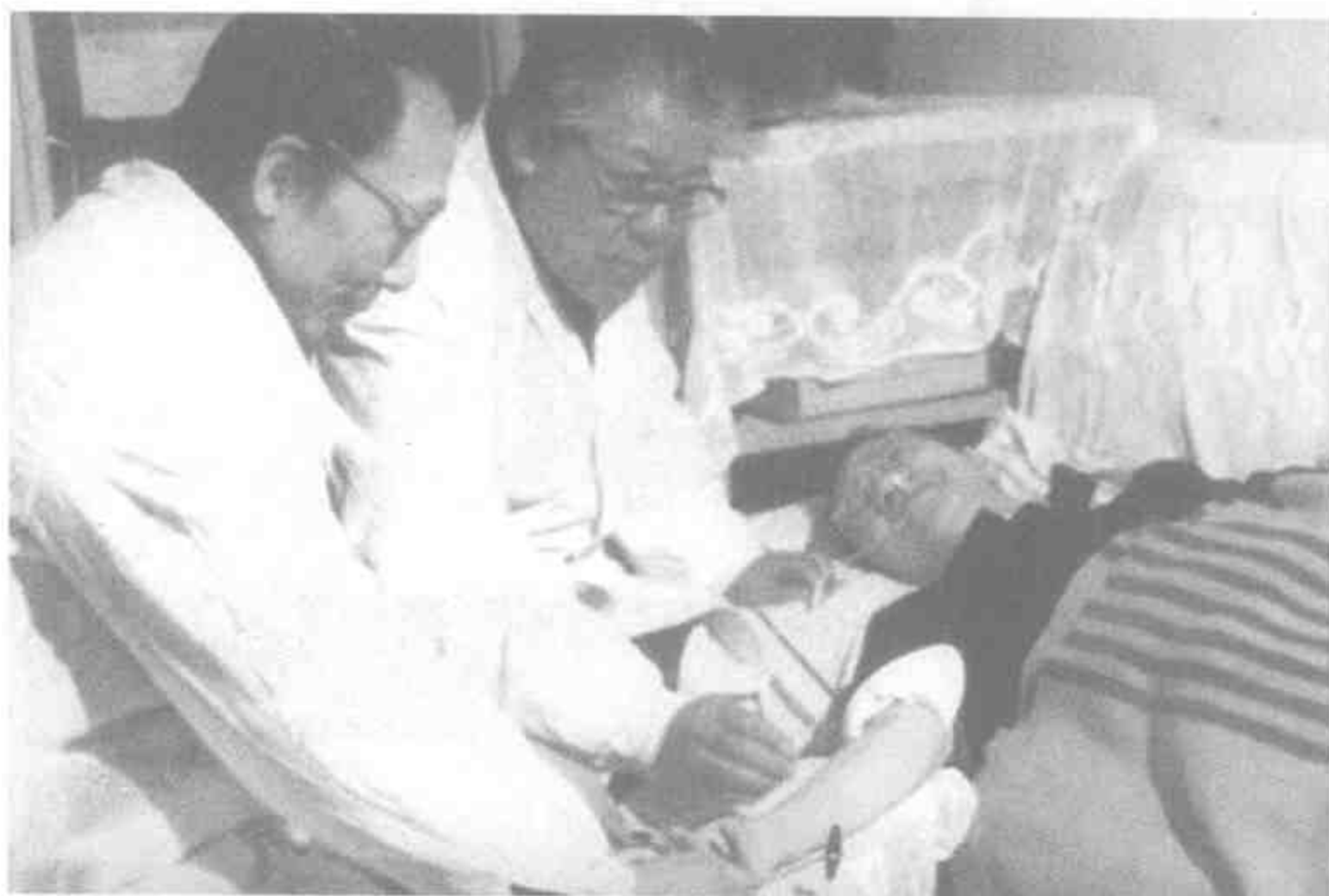
1988年，祝总骧教授、郝金凯教授作针灸经络疗法为数学家陈景润治疗帕金森综合症