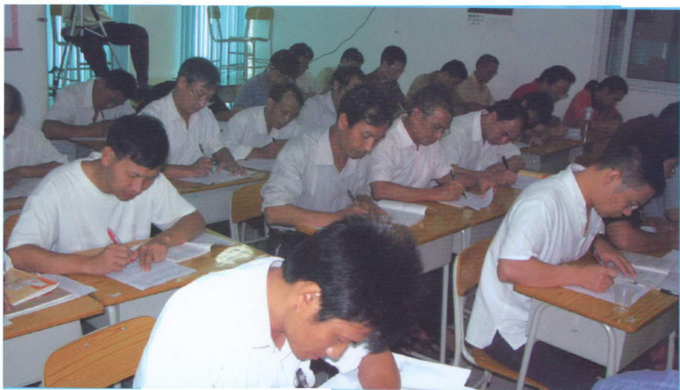
◎学员们在认真阅读八卦奇门创新文化