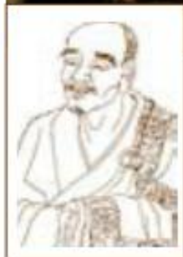
代表人物： 临济义玄