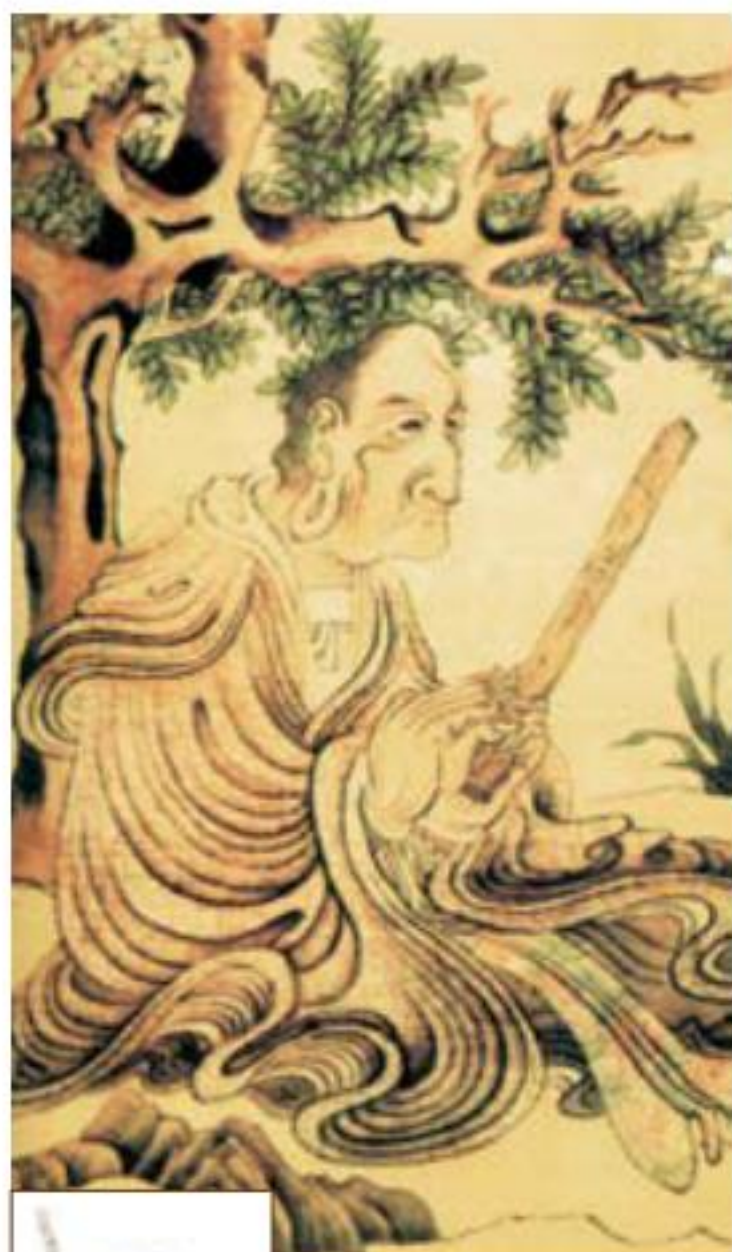
代表人物：德山宣鉴