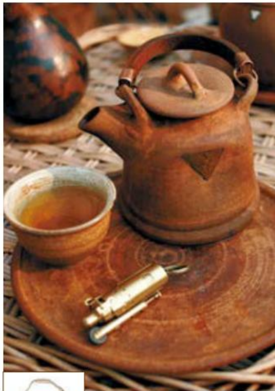
代表人物：赵州从谏