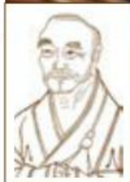
代表人物： 赵州从谏