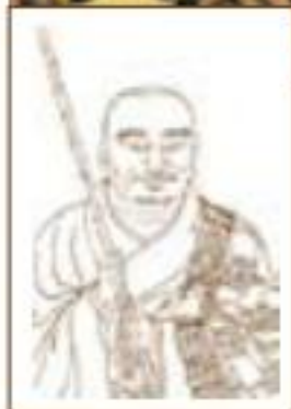
代表人物： 德山宣鉴