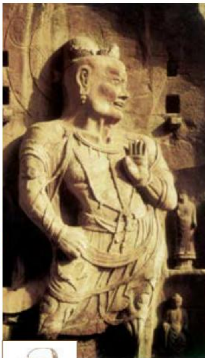
代表人物：临济义玄