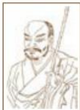
代表人物： 云门文偃