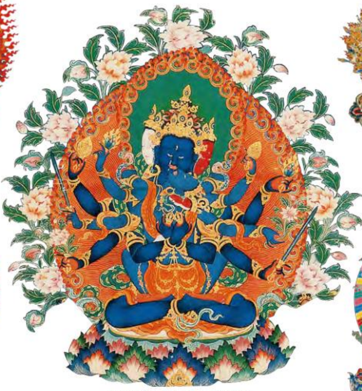
无上瑜伽密续之王——密集金刚 转化贪、嗔、痴、慢、疑等 五毒为五种智慧