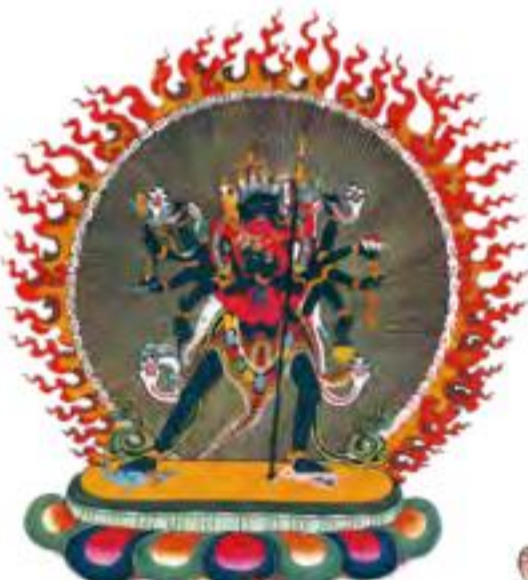
无上瑜伽母续本尊之首 ——胜乐金刚 消除贪毒，驱除成佛障碍 的母续本尊之首