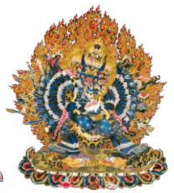
密续死亡征服者 ——大威德金刚 能驱除死亡，克除嗔怒 的父续本尊