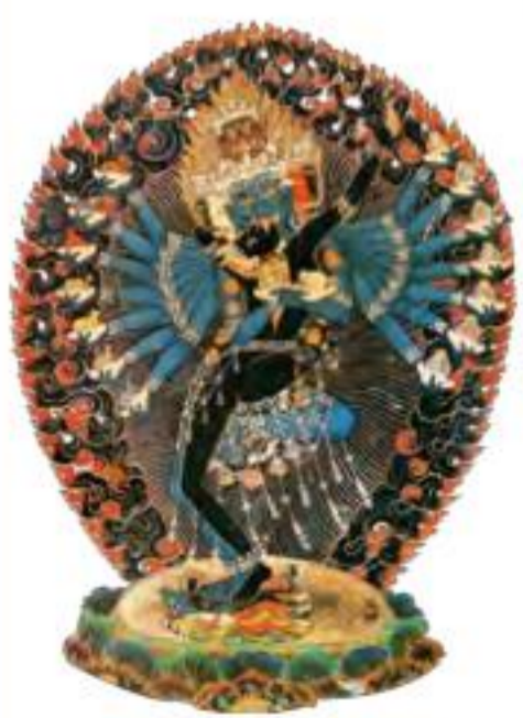
无上瑜伽身心合一本尊 ——吉祥喜金刚 洞悉自我执迷，使身心合一 化解一切对立的母续本尊