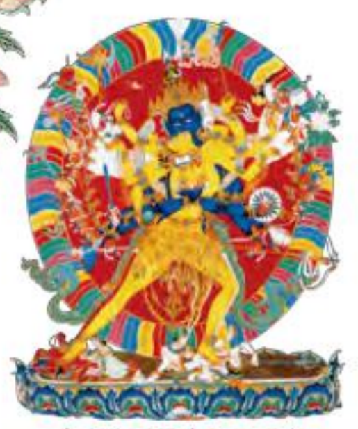
密宗真理最完美显现者 ——时轮金刚 引导众生脱离迷界的不二 续本尊