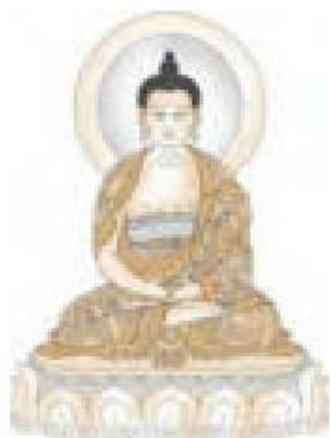
禅定印释迦牟尼佛