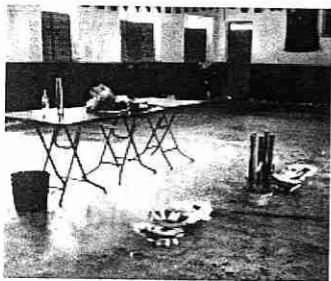
這是動土祭神的用品

在三個月前，筆者應邀到元朗某圍村進行動土祭儀，該村民代表更事徵詢筆者的意見，之前還請早已移居海外的元老村民回來，一起參予此盛事，可見他們對動土儀式的重視程度。