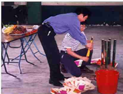
燒化符紙是祭神過程中不可或缺的部份

(2) 三煞：為歲煞、劫煞、災煞的合稱。《神樞經》謂「陰氣」是也。或謂三煞者，三合五行當旺之沖，故有「宜向不宜坐」之說。《協紀辨方書》卷八《選擇宗鏡》曰：「三煞最凶，坐三煞，向太歲，此不能制者也，不可犯也。」三煞所在之方之辰，如動土等，必須避忌。