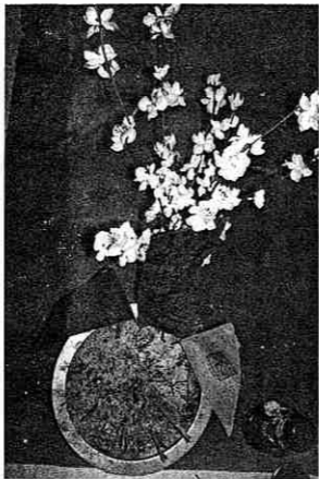
桃李和合大法最特別是需 要一枝桃花和一枝李花。