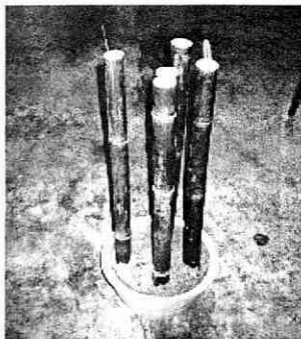
將青杖插在沙盆中，用來鎮煞辟邪