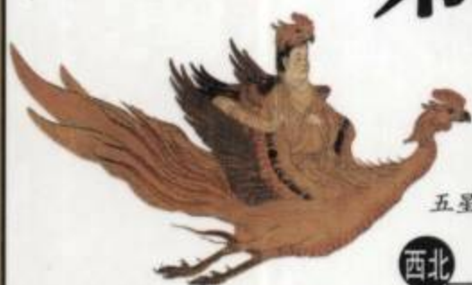
太白星神 五星之一，五行属金