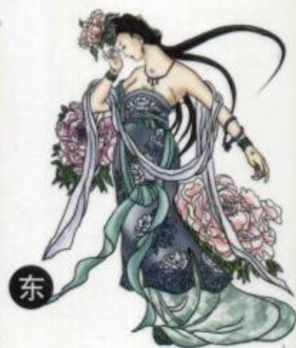
子将神后 阴私、暗昧、妇女之神