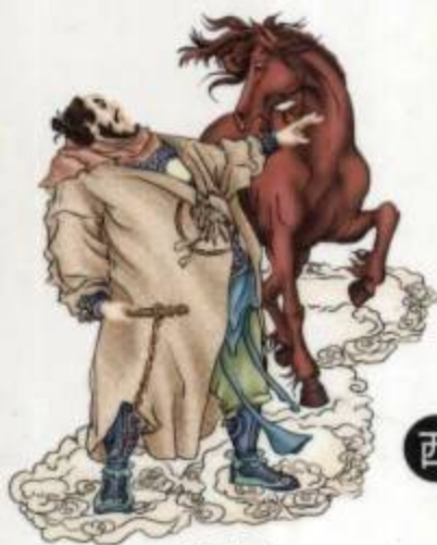
午将胜光 光怪、丝绵、文书之神