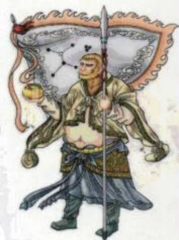
申将传送 道路、疾病之神