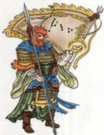
西将从魁 赏赐、解散、金刀之神