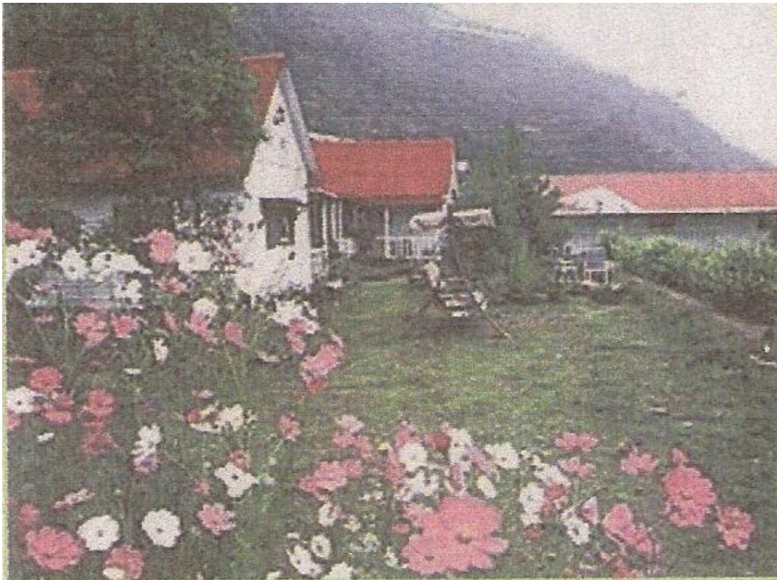
浅红色屋顶是其正面