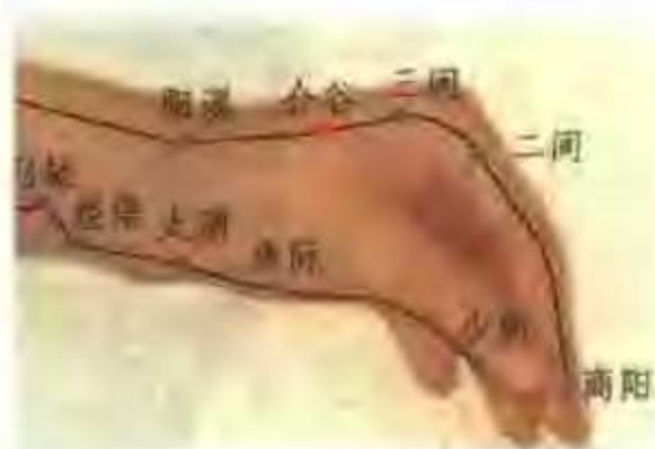
图 1-4 合谷