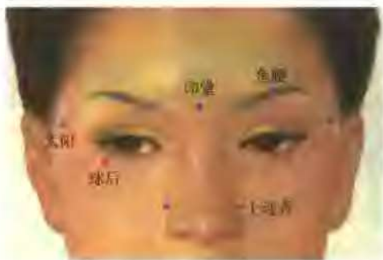
图 1-3 球后

(2)操作: 上穴寻找敏感点,刺入皮内针用胶布固定,嘱咐病人自行按压,每天3次,每次3~5分钟,3~5天更换一次。15天为一疗程,疗程间隔10天。