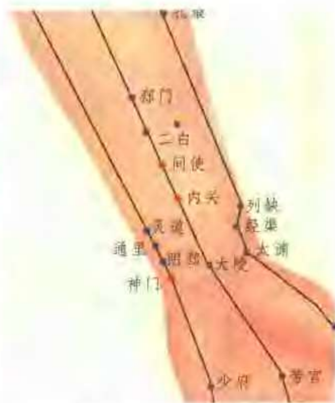
图 1-2 间使、内关、神门

鸠尾是治癲、狂、癩及脏躁之要穴；三阴交有健脾疏肝补肾与气血双补之功；丰隆和胃豁痰；足三里健胃益气，升清降浊，配中脘更能加强培土建中州之效；期门泻肝解郁；内关为心包络穴，别走三焦，为阴维交会，若气道壅塞以通之；间使为手厥阴之脉所行之经，神门为手少阴之原穴，二穴镇惊安神。