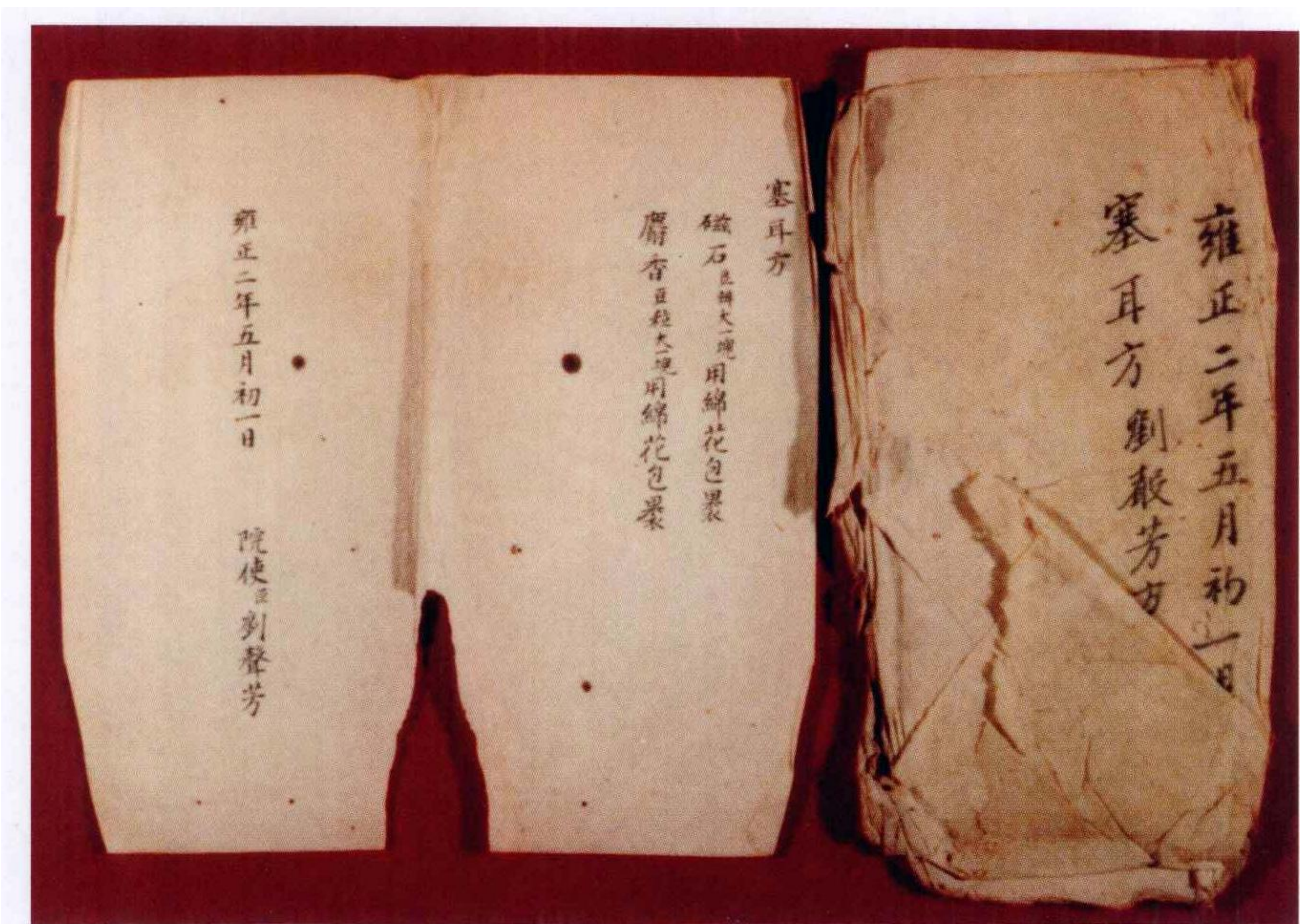
雍正朝太医院院使刘声芳塞耳医方