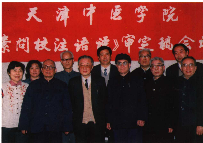
1989年2月参加人民卫生出版社主持的《素问校注语释》审定稿会议。