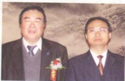
个原国家中医药管理局国际合作司司长、中国民间中医医药研究开发协会会长、世界针灸学会联合会秘书长沈志祥教授与人文手诊学派创始人樊红杰先生于2009年10月24日在人民大会堂参加了首届全国民间中医药科学发展大会并合影留念。