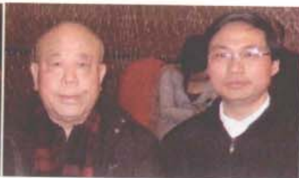
个原卫生部中医司副司长、中医研究院党委书记、中华全国中医学会副会长、中国针灸学会会长、世界针灸学会联合会主席、卫生部副部长兼国家中医药管理局局长胡照明教授与人文手诊学派创始人樊红杰先生于2009年1月10日在北京和平宾馆合影。