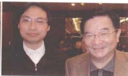
个国家中医药管理局党组织成员、副局长房书亭教授与人文手诊学派创始人樊红杰先生于2009年1月10日在北京合影。