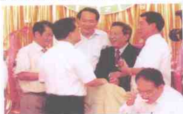
潮州市陈浩文市长向骆文智市委书记介绍陈益石教授医术高明。