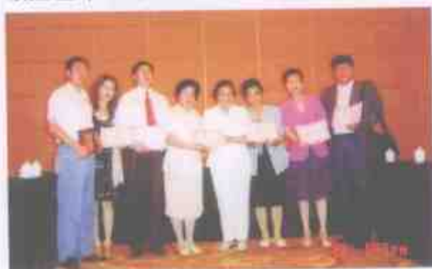
国际中医药大学荣誉主席冯理达教授为大学诸位专家颁发证书。