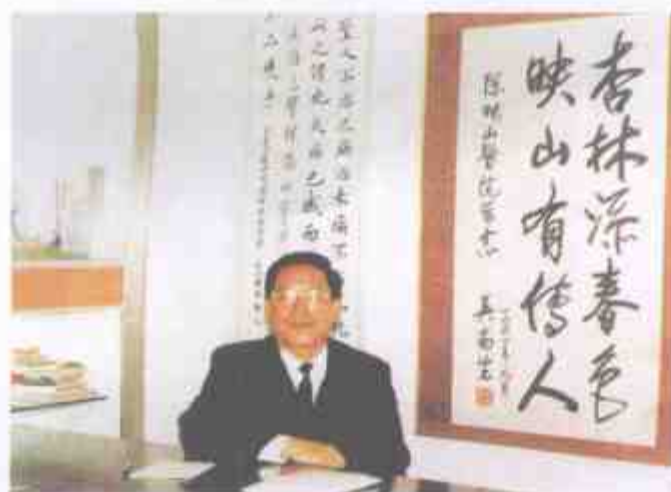
原广东省省委书记吴南生题词“杏林添春色，映山有传人”。